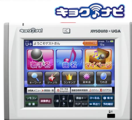
図:「Entier」を採用した「キョクナビ(JR-300)」