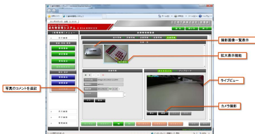
図1: 「遺失物管理ソリューション」画面(例)

日立ソリューションズが今回販売を開始する「遺失物管理ソリューション」では、各拠点で発生する拾得物の情報を一元管理することで拾得物の拾得場所以外の拠点からも即時に検索することが可能となり、検索作業の迅速化と返却率の向上を図ることができます。また、警察提出用資料も作成できるため、拾得物管理業務の負荷低減を図ることができます。