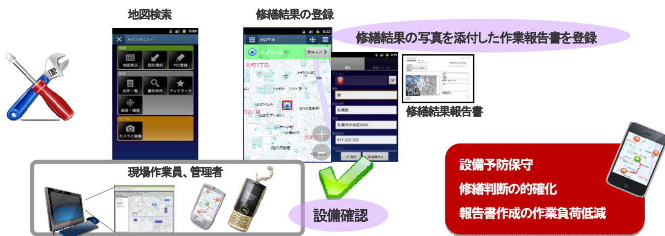
図2: 屋外設備のメンテナンス業務への適用例

社内で管理している設備管理データをスマートフォン上で操作することができます。直感的な操作で地図移動やデータ登録を行い、設備工事の現場からの修繕結果の写真を添付した作業報告書の登録、工程表など関連ファイルの登録などが可能です。作業員が登録したデータは、他の現場作業員や管理者からスマートフォンや携帯、社内PCを使って確認できます。設備管理データを部署間で共有することで設備の予防保守や修繕判断の的確化が容易になります。また、報告書作成の作業負担軽減などが図れ、設備管理業務の効率化を実現します。