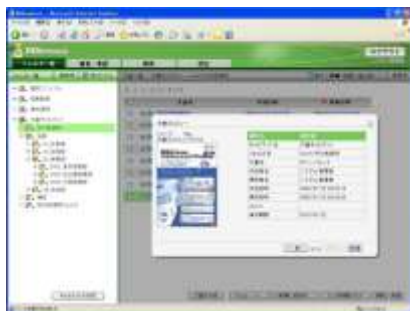
■ フォルダー一覧とプレビュー表示画面