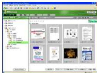
■ サムネイル表示画面