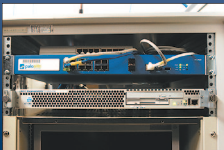
広島市の放射線影響研究所に設置されたPA-2020

アプリケーションの可視化によって、予想した通りストリーミングなどの動画関連が帯域を占有していることが把握できました。外部の研究者が配信している動画を閲覧している場合もあれば、業務に関係ない動画サイトの利用も一部見受けられます。研究機関の特質として、研究者の利便性を最優先させなければなりませんので、トラフィックの内容を明確にし、研究者の自由度を保ちながら通信制御することが重要です。日立ソリューションズのPA-2020がそれを可能にしてくれると期待しています。