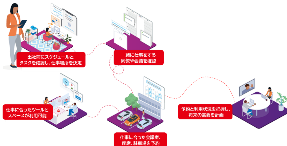
図1 Condecoの利用イメージ

日立ソリューションズは、本サービスをビルや施設などの設備の効率化でスマートビルディングを実現するソリューションのラインナップに追加し、設備の有効利用やオフィススペースの最適化、ソーシャルディスタンスへの取り組みを推進する企業のデジタルトランスフォーメーションを支援していきます。