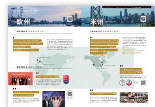
海外グループ会社の 取り組み