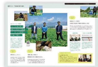
国内グループ会社の 取り組み