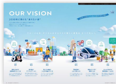
2030年に向けたビジョン