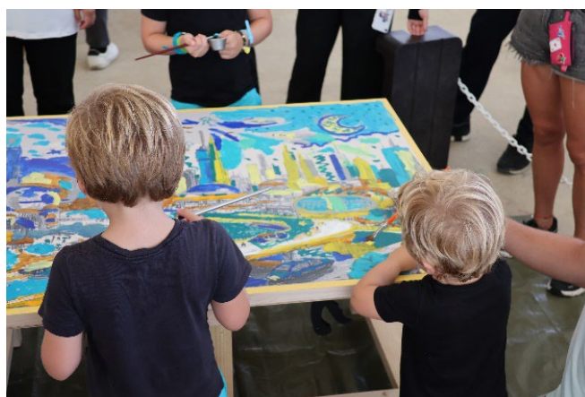
ワークショップ実施の様子

株式会社日立ソリューションズ（本社：東京都品川区、取締役社長：森田 英嗣／以下、日立ソリューションズ）は、2025 年日本国際博覧会（以下、大阪・関西万博）において、協賛しているシグネチャーパビリオン「いのちの遊び場 クラゲ館」(以下、クラゲ館)にて、9 月 12 日、13 日、19 日の 3 日間、体験型プログラム「みんなで彩る いのちのアート ～2050 年の未来のまちを描くワークショップ～」を開催しました。ワークショップは計 47 回実施され、合計 476 名が参加しました。