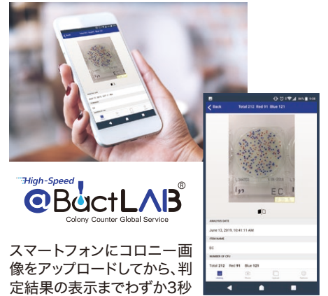
スマートフォンにコロニー画像をアップロードしてから、判定結果の表示までわずか3秒

日立ソリューションズはこれからも、独自の技術とサービス開発により、世界を舞台に新たな価値やイノベーションを生み出していく同社と協創していきます。