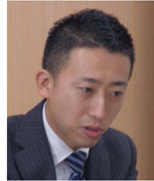
セキュリティソリューション部 技師