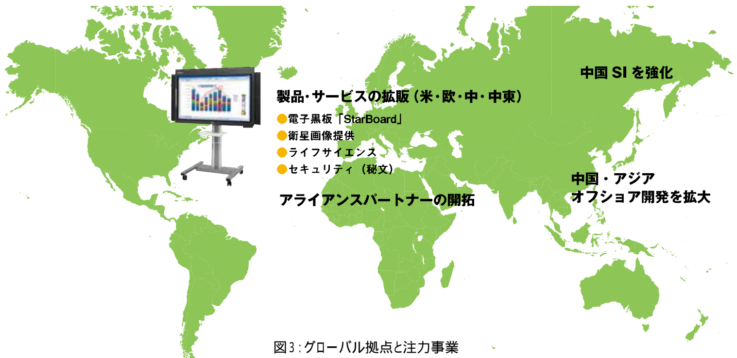
図3: グローバル拠点と注力事業

グローバル事業では、米国・欧州・中国の3大拠点体制となり、さらにベトナムなどの拠点も利用し、現地法人のシステム構築や海外市場に向けた製品・サービスの提供を加速していきます。現在は、電子黒板「StarBoard」を中心に、ライフサイエンス、衛星画像、ストレージプロダクト、組み込み向けミドルソフトなどの製品・サービス提供、日系現地法人向けシステム構築、アライアンスパートナーの開拓、を中心に展開しています。中国ビジネスも、日系現地法人向けのSIサービスなどを中心に拡大していきます。今後はこれらの既存事業を更に拡大するとともに、新規市場の開拓を積極的に推進していきます。(図3)