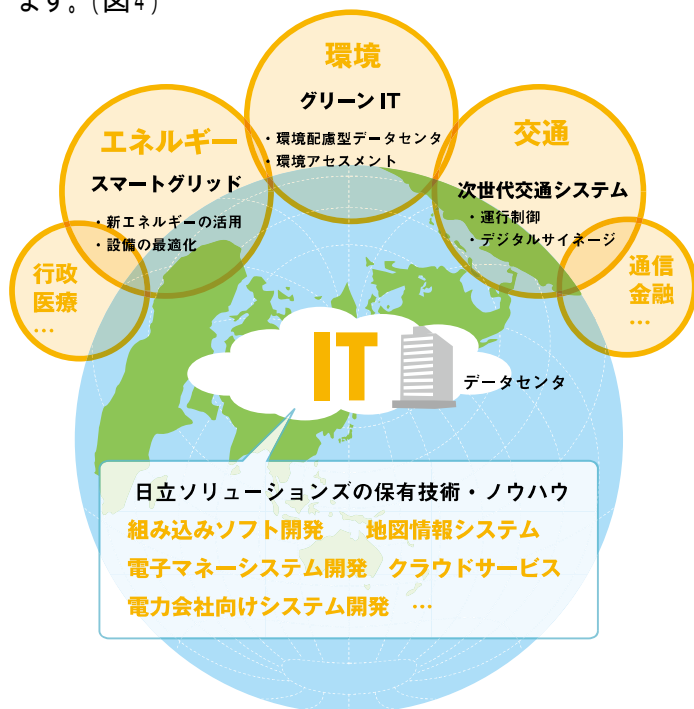
図4：社会イノベーション事業

今後、都市への人口集中や高齢化社会、環境への配慮などを背景に、社会インフラの整備のニーズが高まることが予想されます。新たな社会インフラは、高付加価値で低環境負荷であることを求められており、ITと融合することで実現していくことが期待できます。当社は地図情報システム「GeoMation」、組み込みソフト開発のノウハウ、電力・ガス会社など社会インフラ向けの開発実績などがあり、今注目されているスマートグリッドなどへの対応を強化していきます。さらに、電力や交通などさまざまな分野で社会インフラを提供してきた日立グループ各社とともに、ITの分野から新しい社会インフラ作りに取り組み、社会イノベーションを推進していきます。(図4)