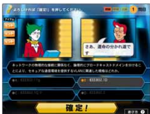
画像3: アキラのクイズセキュオネアの画面

日立ソリューションズは、2010年10月の日立ソリューションズ誕生記念の企画として、クイズ形式で楽しみながら情報セキュリティを学ぶことができる「セキューマン検定【外伝】アキラのクイズセキュオネア」を2010年11月9日から2011年1月31日まで公開しています。