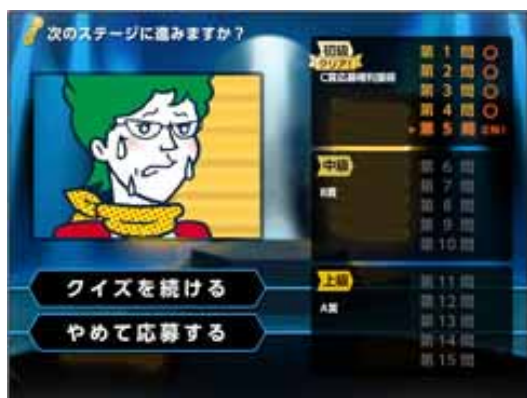
画像4: アキラのクイズセキュオネアで5問連続で正解した際の画面

「アキラのクイズセキュオネア」は、これまで公開してきた好評企画「セキューマン検定」のリニューアル版で、情報セキュリティに関する4択形式の問題に15問連続で正解するとプレゼントに応募ができる企画です。5問連続、10問連続の正解でもプレゼントに応募ができます。ただし、途中の問題で不正解となると、その時点で終了となり、プレゼントへの応募ができなくなります。問題は、情報セキュリティに精通した、日立ソリューションズプラットフォームソリューション企画部と人材教育部が監修しています。