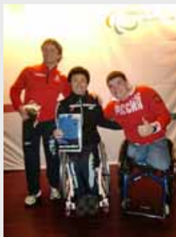
優勝した久保選手(中央)