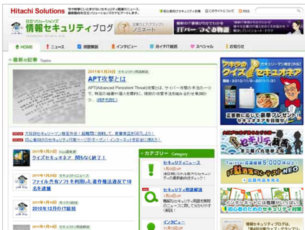
画像1: 情報セキュリティブログのトップページ ( http://securityblog.jp/ )

そこで、日立ソリューションズでは、初心者からネットワーク専門家にいたるまで、幅広い層に情報セキュリティに関する最新動向やニュースを読み解くポイントを解説する「情報セキュリティブログ」を2005年9月に開設しました。今回は、「情報セキュリティブログ」で提供しているコンテンツや関連するイベントなどを紹介します。