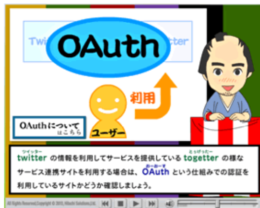
画像6: 「スケハチのセキュリティ講座」画面