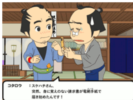
画像5: 「大江戸セキュリティ戯画(ギガ)」画面

日立ソリューションズは、Webアニメーションで楽しみながら情報セキュリティを学ぶことができる教育コンテンツ「大江戸セキュリティ戯画(ギガ)」の第三幕を1月12日から公開しています。