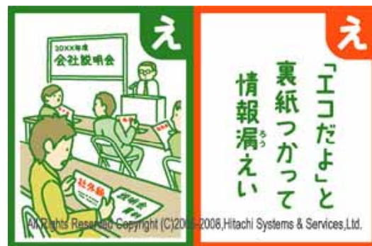
画像2: セキュリティいろはかるたの絵札と読札

「楽しみながら学ぶセキュリティ」をテーマにした企画です。難解になりがちなセキュリティのポイントを「い」「ろ」「は」で始まり「京」で終わる48の「かるたの句」の形式にまとめています。図2の「かるた」の読札は、一般ユーザから募集した作品です。