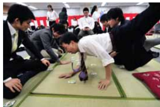
写真1: 昨年のかるた大会の様

また、セキュリティかるたを用いた「かるた大会」を2006年から毎年開催しています。過去、ITベンダやNPO団体を招待した対抗戦などを実施し、熱戦が繰り広げられてきました。