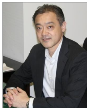
日立東日本ソリューションズ 事業企画開発本部 本部長

「BELINDA」は、ソリューションごとに対象規模や適合するユーザーが明確になっているため、お客様は複数の選択肢からじっくりソリューションを比較検討することができます。また、「BELINDA」は、業務に即して分類しているため、お客様は現行の基幹業務システムとその周辺システムをシームレスに連携するソリューションを「BELINDA」の中から容易に選択することができます。実際に、需要予測関連のソリューションを検討していたお客様に、当社が「BELINDA」の中から日立東日本ソリューションズのプロジェクト管理システム「SynViz」を提案して受注に至ったという事例もあり、グループ一体となって「BELINDA」を提案することで、全国各地のお客様に迅速に最適なソリューションを提供することができるようになりました。