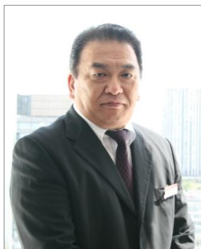
日立ソリューションズ 産業・流通システム事業本部 企画本部 プリセールス部 第2グループ グループマネージャ

当社およびグループ会社担当者が、「BELINDA」を活用することでどのようなメリットがあるのか、またお客様にどのような付加価値を提供することができるのかを紹介します。