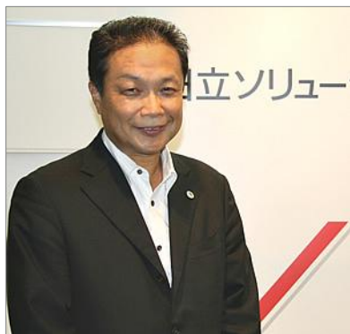
日立ソリューションズ 常務執行役員