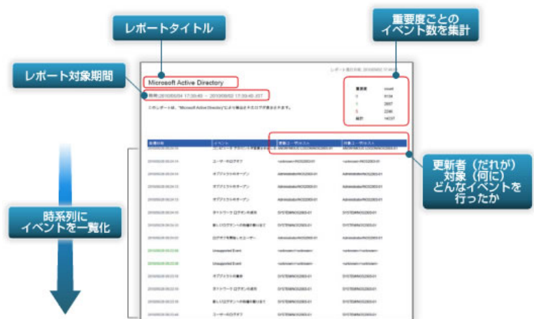
図 2：日本語レポート画面イメージ

今回、日立ソリューションズが開発した Novell Sentinel Log Manager 向け 日本語レポートツールは、Novell Sentinel Log Manager のログ情報をベースに、レポートを自動的に作成します。このテンプレートにより、導入企業の IT 部門は Novell Sentinel Log Manager のレポートのカスタマイズ作業を行う必要がなく、またエンドユーザはレポート作成に要する時間を大幅に削減することができます。