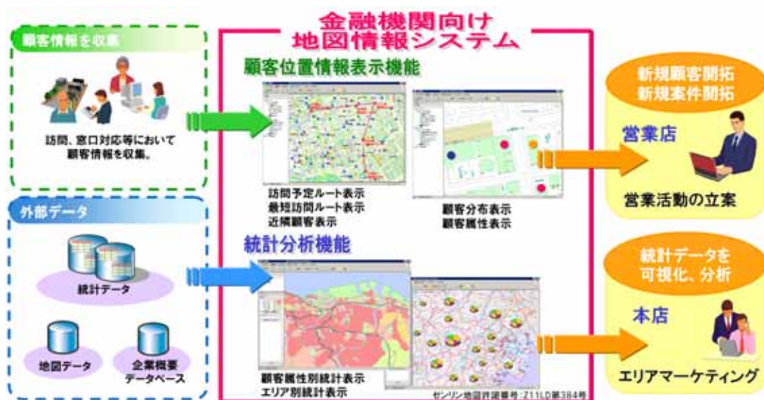
図1 「金融機関向け地図情報システム」の概要

昨今、金融機関では自行の優良顧客を維持拡大していくための営業活動の効率化や強化が経営課題の一つであり、そのため、現状とは異なる新しい視点での市場分析が急務となっています。日立ソリューションズでは、エリア毎の顧客特性の把握、およびエリアポテンシャルにあった営業リソースの配分をしたいという金融機関のニーズに対応し、営業支援システムと地図情報システムを組み合わせた新たな金融機関向けソリューションとして、地理情報システム（GIS）「GeoMation」を活用したシステム「金融機関向け地図情報システム」の販売を開始します。「金融機関向け地図情報システム」は顧客情報、外部企業情報、およびエリア別統計情報を地図上にダイナミックにリンクし、さまざまな形でビジュアル表示するシステムです。それら営業活動に密接に関わる情報を視覚的・統計的に把握することで、営業店での訪問計画立案やエリアマネジメントといった営業活動の立案、本部での店舗戦略や営業店、エリア別目標設定等のエリアマーケティングを支援することが可能となります。例えば、あらかじめ、訪問を予定しているお客様や、その近辺の取引の見込めるお客様の位置と最適な訪問ルートを表示することで、効率的な営業活動を行うことが可能となります。