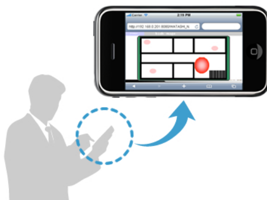
図2. スマートフォンに位置検知結果を表示するイメージ