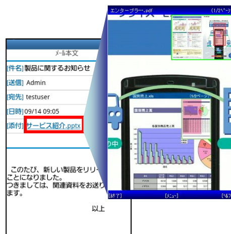
図1:メールと添付ファイルの閲覧画面(例)

専用のドキュメントビューアにより、メールの添付ファイルや社内ファイルサーバーのドキュメントファイルや画