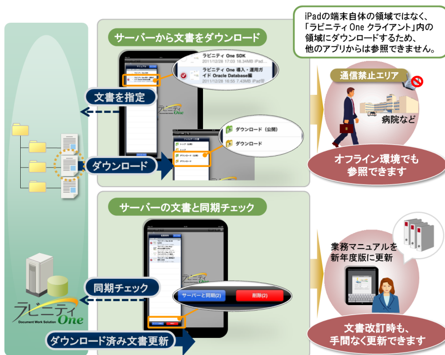
図1. 文書のオフライン参照イメージ(ラビニティ One iPad連携オプション)