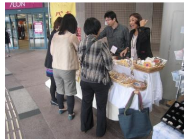
写真: 1 Day Shopの様子