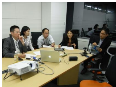
ゲスト講師とのインタビュー