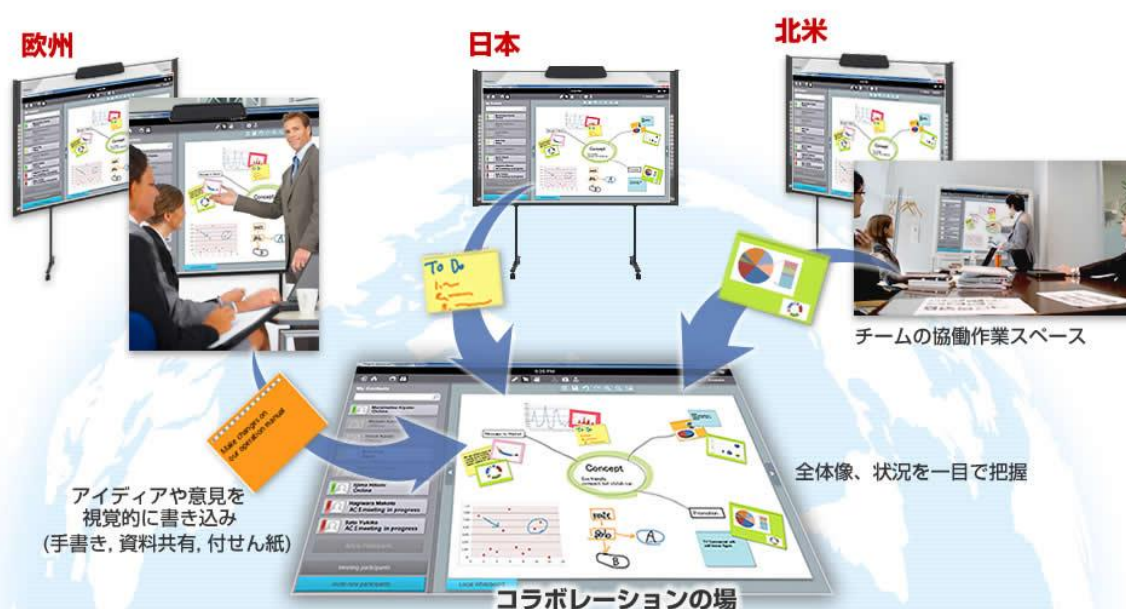
図2:「Hitachi Advanced Collaboration System」を利用したコラボレーションのイメージ