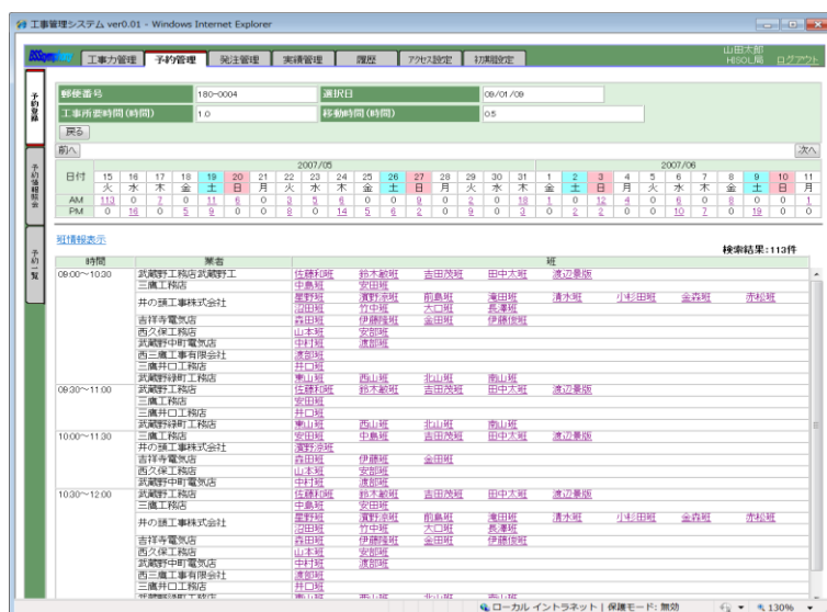
図1: 「BSSsymphony PRITM for 工事管理」の画面

さらに、ケーブルテレビ事業者向け顧客管理システム「BSSsymphony PRITM for SMS(顧客管理)」と連携することで、工事番号や顧客情報の共有が図れ、ケーブルテレビ事業者の業務プロセスの一元管理、効率化が図れます。