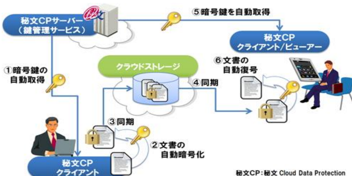
図:「秘文 Cloud Data Protection」の概要

「秘文 Cloud Data Protection」は、透過的にファイルの暗号化と復号を行うため、利用者は秘文サーバーにログインするだけでクラウドストレージをセキュアに利用することができます。また、秘文サーバーでの鍵管理サービスにより、ログインアカウントに紐づいたアクセスコントロールを実現しているため、企業やプロジェクト毎の機密性を確保しながらファイルを共有することが可能です。