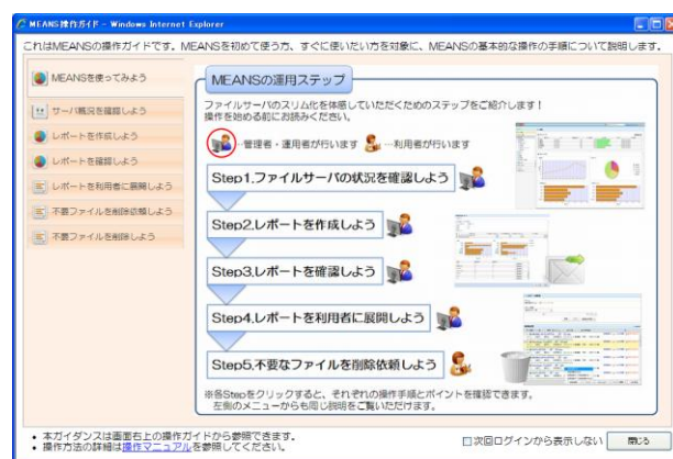
図 2: 操作ガイド