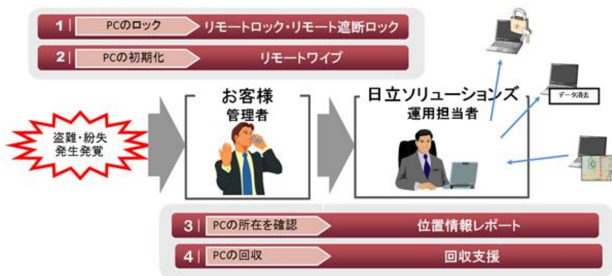
図:「モバイルPC 盗難・紛失対策サービス」の概要

24時間365日対応するため、早朝や深夜であっても即時にセキュリティ対策を施すことができます。また、海外出張中の盗難・紛失においても、「端末回収支援サービス」により、捜索にかかる時間やコストを低減します。