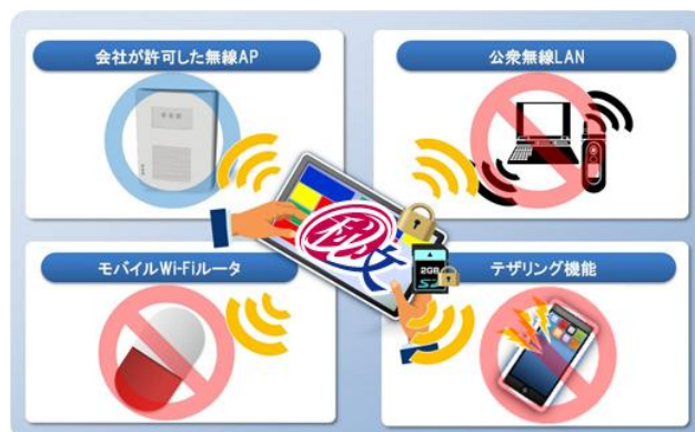
図:「秘文 AE SmartDevice Extension」の利用イメージ