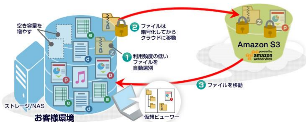
図:「活文 Hybrid Storage Manager」の概要

そこで、日立ソリューションズは、ストレージ容量の拡張・縮小が簡単にでき、使用分だけの料金を支払うだけでよいAmazon S3のメリットを活用して、企業が保有するストレージの空き容量を増やし、既存ストレージの有効活用を実現するストレージサービス「活文 Hybrid Storage Manager」の提供を開始します。本サービスの主な特長は以下の通りです。