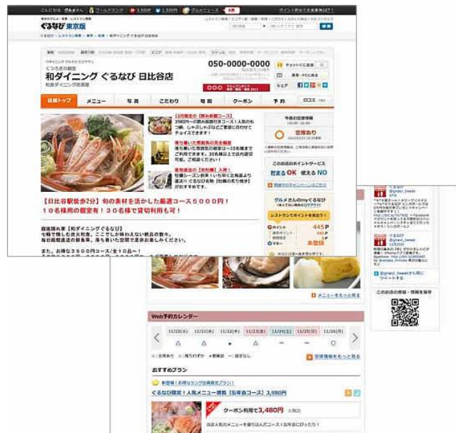
図1:店舗ページの画面例

これにより、加盟飲食店とインターネット利用者において以下の導入効果がありました。