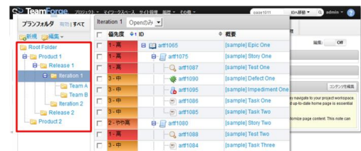
チケット管理画面