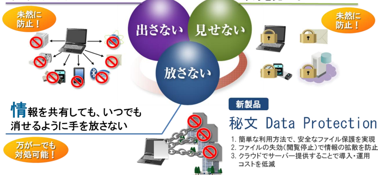
図 1:「秘文」新コンセプトの概要