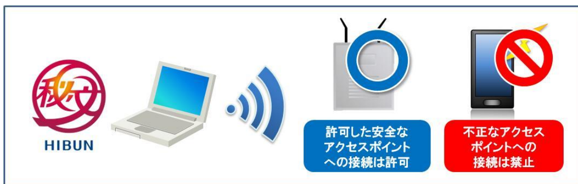
図1: 「秘文AE APC」によるWi-Fi制御

URL: http://www.hitachi-solutions.co.jp/hibun/sp/product/ae_apc.html