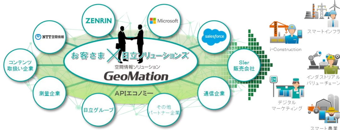
図1 : 空間情報のエコシステムのイメージ

日立ソリューションズは、今後、「GeoMation」と関連ソリューションをグローバルに提供し、2020年度に年間150億円の売上をめざします。