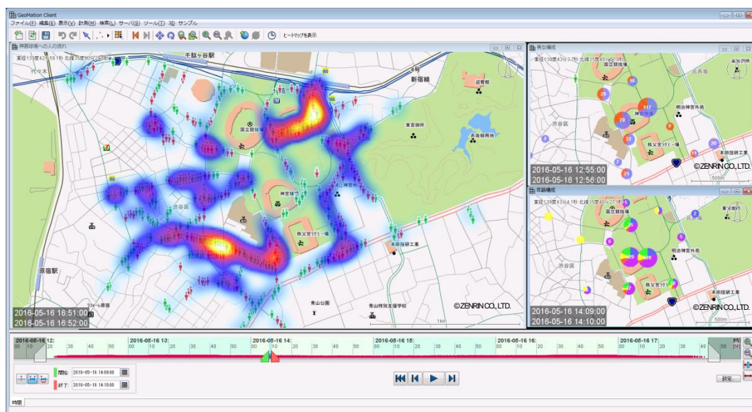
図2 : 人流データをエリアマップに表示

人や車の流れなどのGPS(全地球測位システム)情報を分析・集約し、ヒートマップやグラフ、等値線などで地図上にリアルタイムに表示し、エリアマーケティングなどで活用できます。ビッグデータ対応においては、従来、日立製作所の高速データアクセス基盤「Hitachi Advanced Data Binderプラットフォーム」との連携やクラスタリング構成で、システムの性能や信頼性を確保しています。