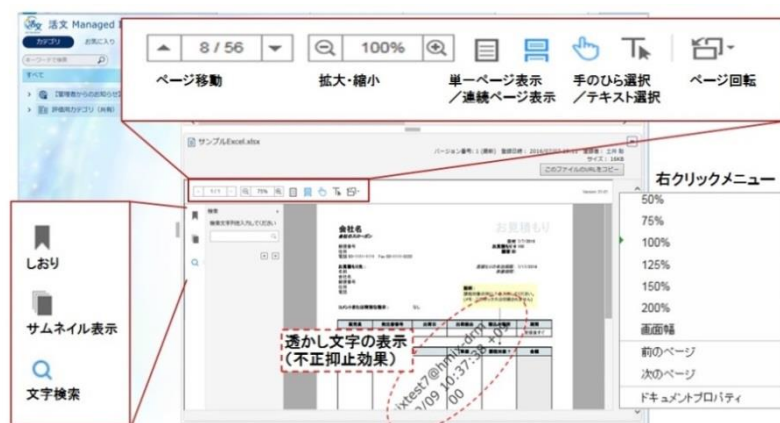
図2 セキュアプレビュー画面