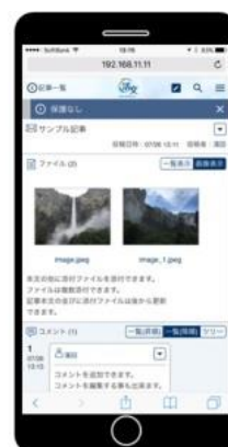
図1 スマートフォンの画面イメージ