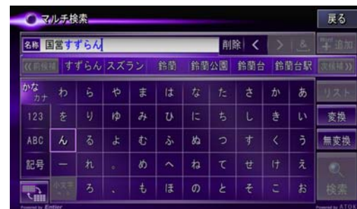
思いついたキーワードで検索 できる「マルチ検索画面」

carrozzeriaおよび®サイバーナビ®はパイオニア株式会社の登録商標です。