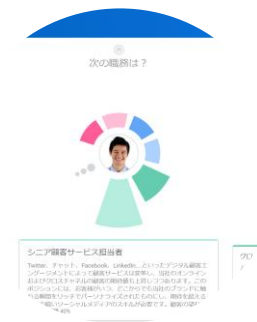
オポチュニティグラフ