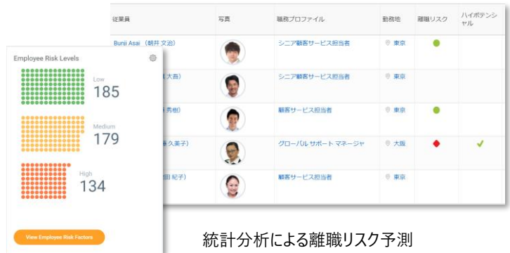
統計分析による離職リスク予測

潜在的な離職リスクをWorkday ヒューマン キャピタル マネジメント内の人事・人財データの統計分析により予測できます。離職防止に向けた早期発見・対応に役立てることができます。